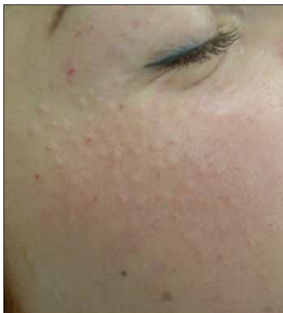
Рис. 1. Техника введения нативной гиалуроновой кислоты в параорбитальной области. Материал: Surgilift. Техника: внутридермальные папулы. Глубина введения: средние слои дермы. Объем введенного материала: 0,1–0,2 мл

Пациентам с толстой пористой кожей, глубокими морщинами рекомендуется сочетание биоревитализации с фракционным неаблятивным лазерным повреждением кожи (фракционным фототермолизом). Лазерное излучение длиной волны 1550 нм вызывает коагуляцию эпидермиса и дермы на глубине до 1,5 мм. Роговой слой эпидермиса при этом не повреждается, благодаря чему сохраняются барьерные функции. Выброс протеолитических ферментов запускает процессы ремоделирования и в окружающих микротермальные лечебные зоны интактных участках дермы. Медиаторы стресса вокруг зоны коагуляции инициируют метаболическую активность фибробластов и других клеток дермального матрикса, что приводит к активизации синтеза структурных компонентов дермы – коллагена и эластина – и неоваскуляризации [2]. Суть ремоделирования, индуцированного фракционным фототермолизом, заключается в том, что одновременно с синтезом новой ткани на месте пораженной обновляются и клеточные элементы, окружающие зоны повреждения. Принципиальное отличие фракционного фототермолиза от ранее проводи-