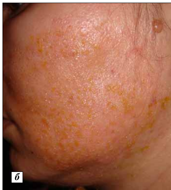
Рис. 2. Контактно-аллергический дерматит на аппликационную анестезию, проводимую перед процедурой биоревитализации